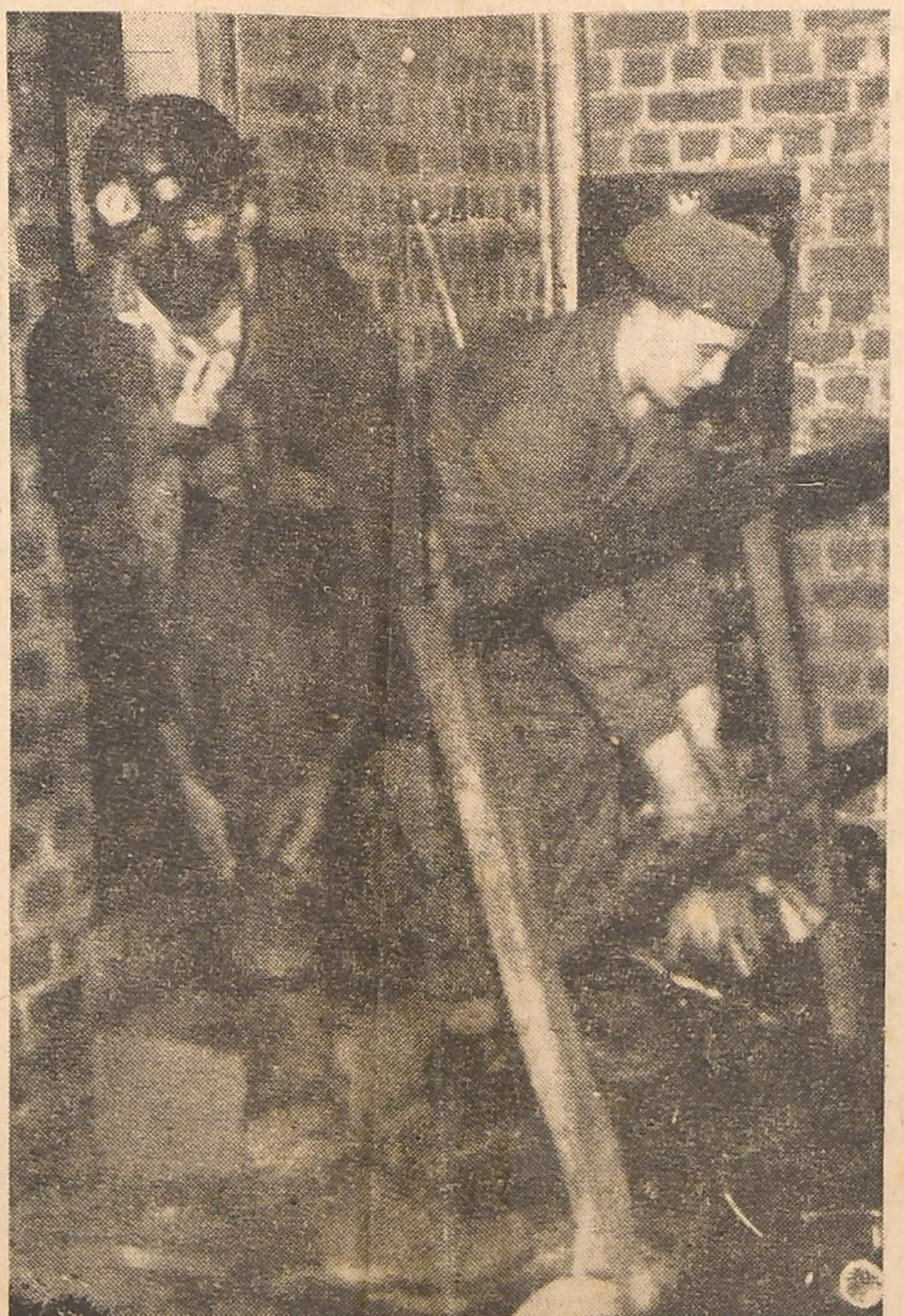
Un sauveteur vient de remonter. Avant de se débarrasser de ses vêtements, il a confié ses rants à un soldat qui les plonge dans un seau de désinfectant.