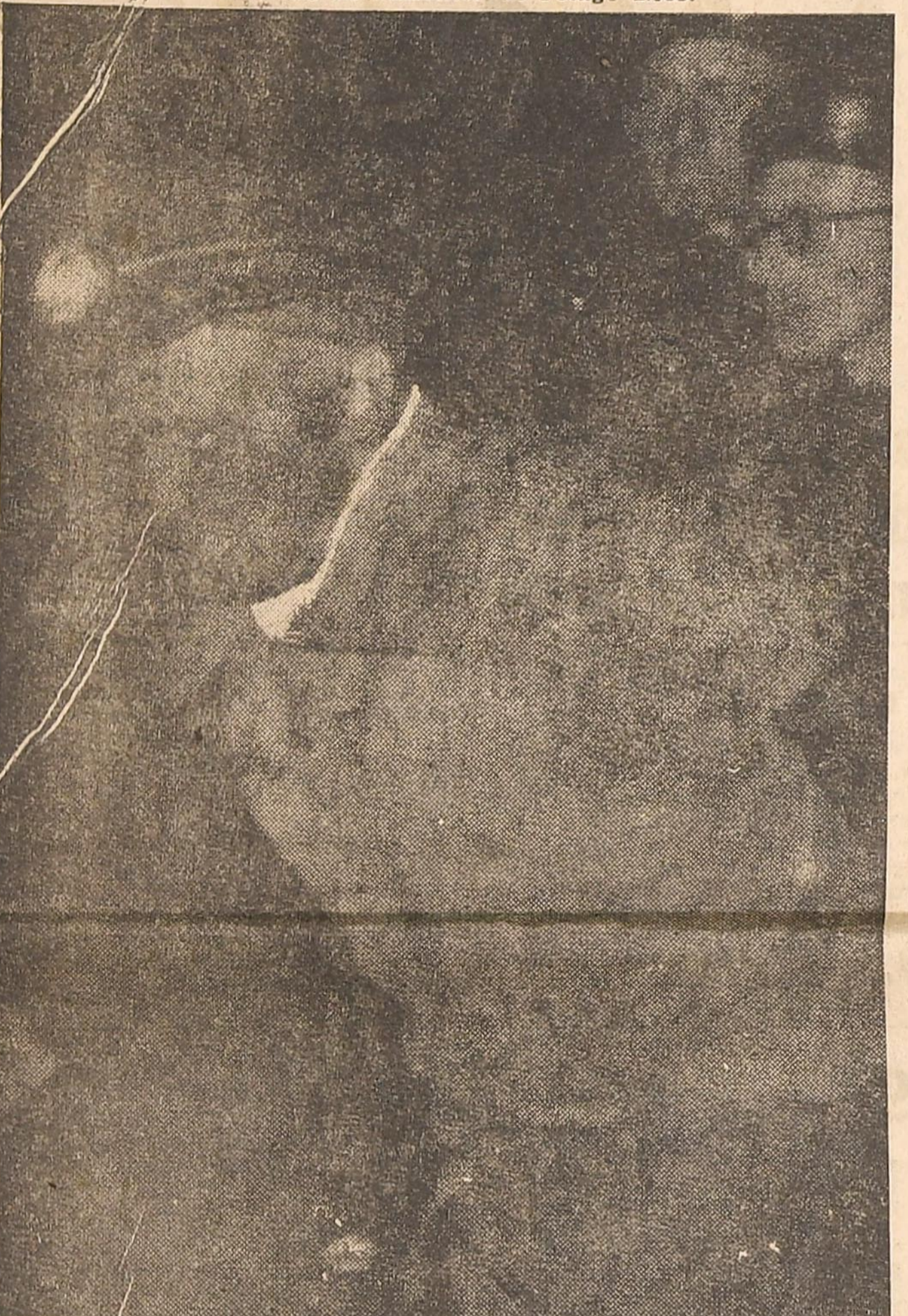
Le masque de ce sauveteur, qui revient de 1035, montre le souvenir qu'il garde de ce qu'il a vu dans la galerie tragique.