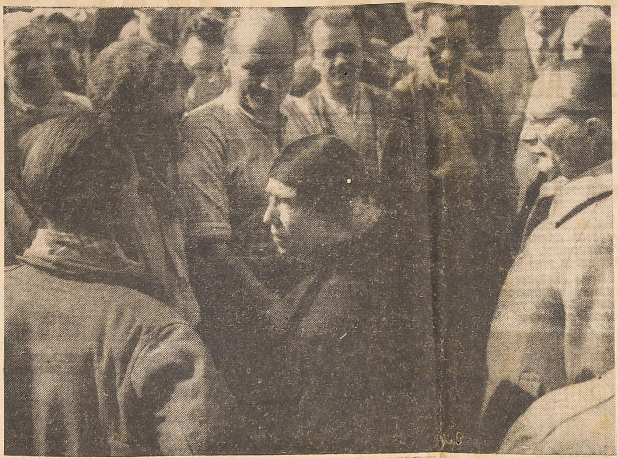
La Reine s'entretient avec quelques-uns des sauveteurs.