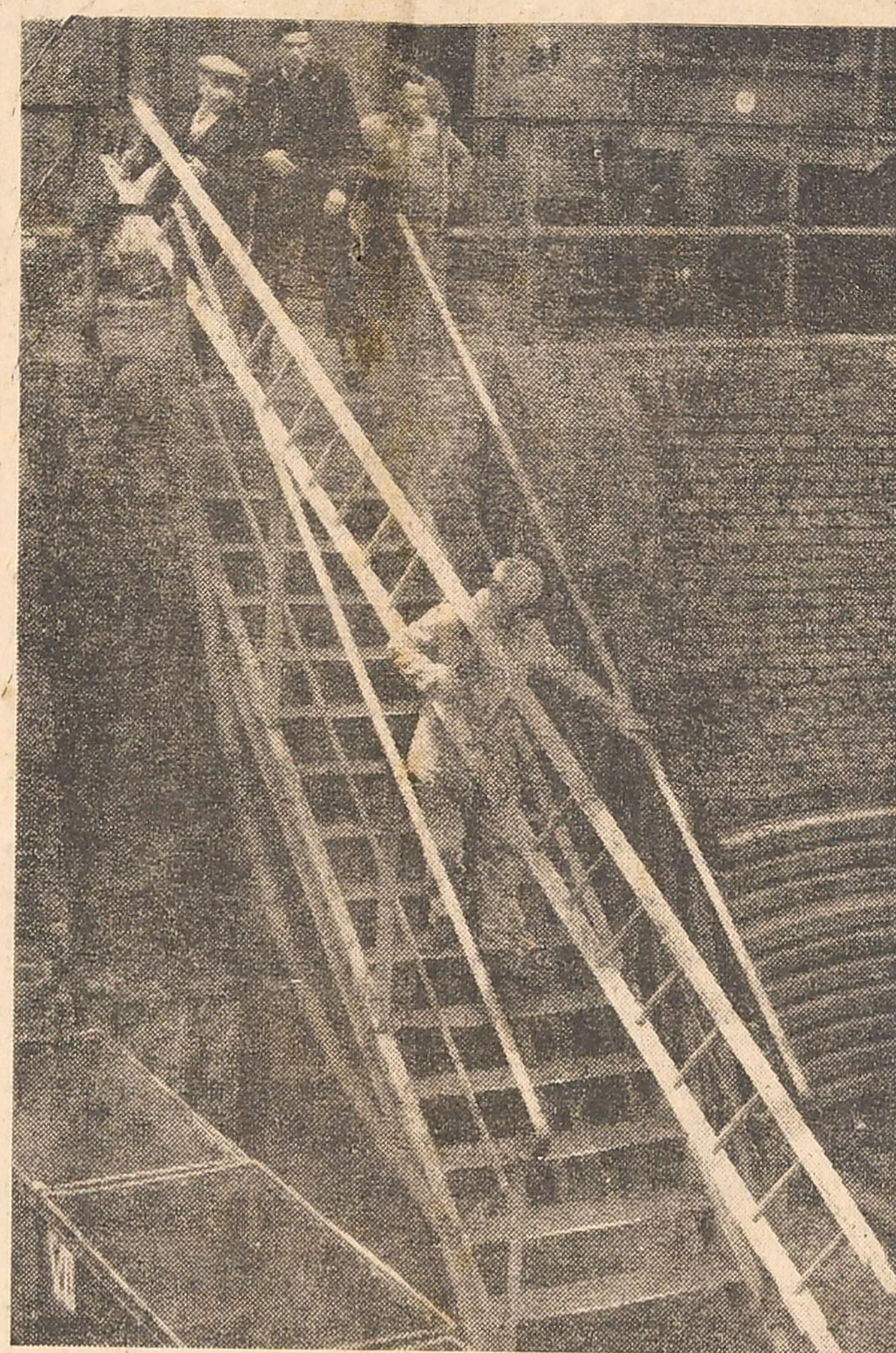
Nous avons annoncé que mardi dans la soirée, des échelles en aluminium avaient été amenées au puits du Cazier. Ces échelles étaient destinées à faciliter l'accès à la plate-cuve située à 1020 m. Voici l'une de ces échelles.