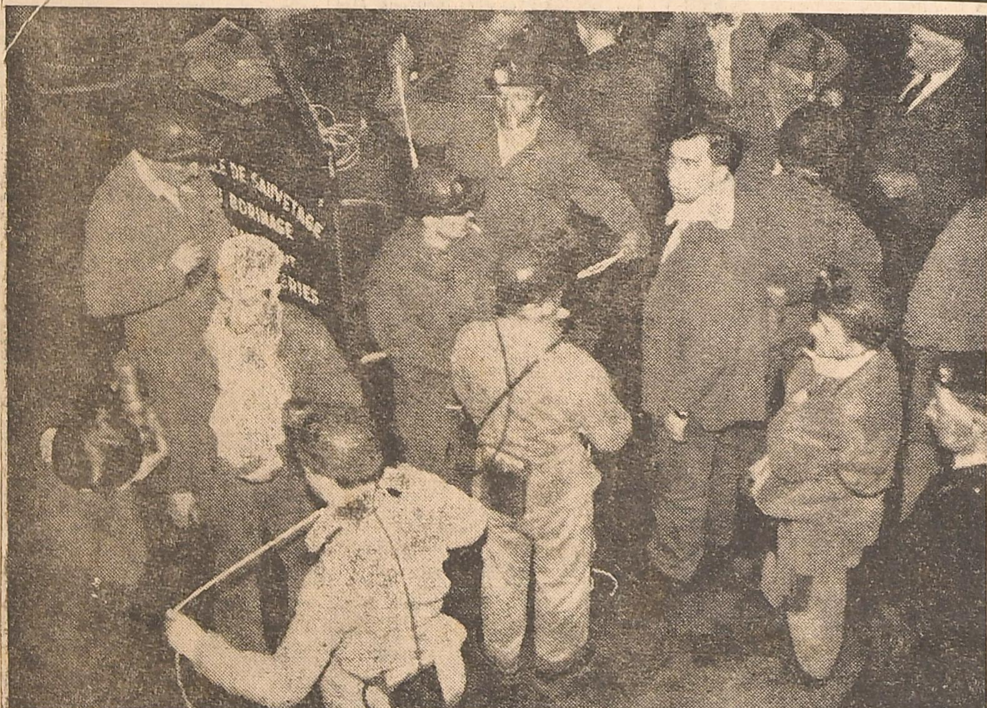
Avant de descendre, un groupe de sauveteurs de la Centrale de Frameries, vérifie la solidité des cordes et le bon fonctionnement des lampes.